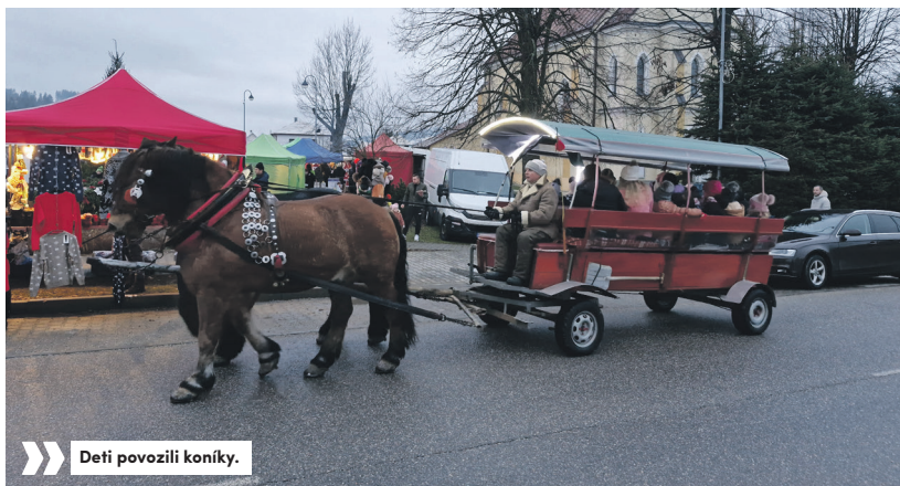
» Deti povozili koníky.