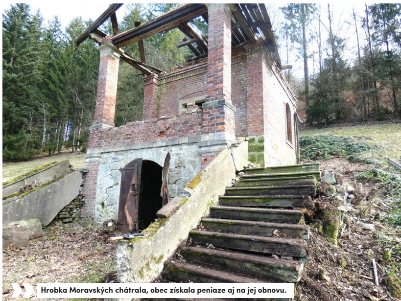
» Hrobka Moravských chátrala, obec získala peniaze aj na jej obnovu.