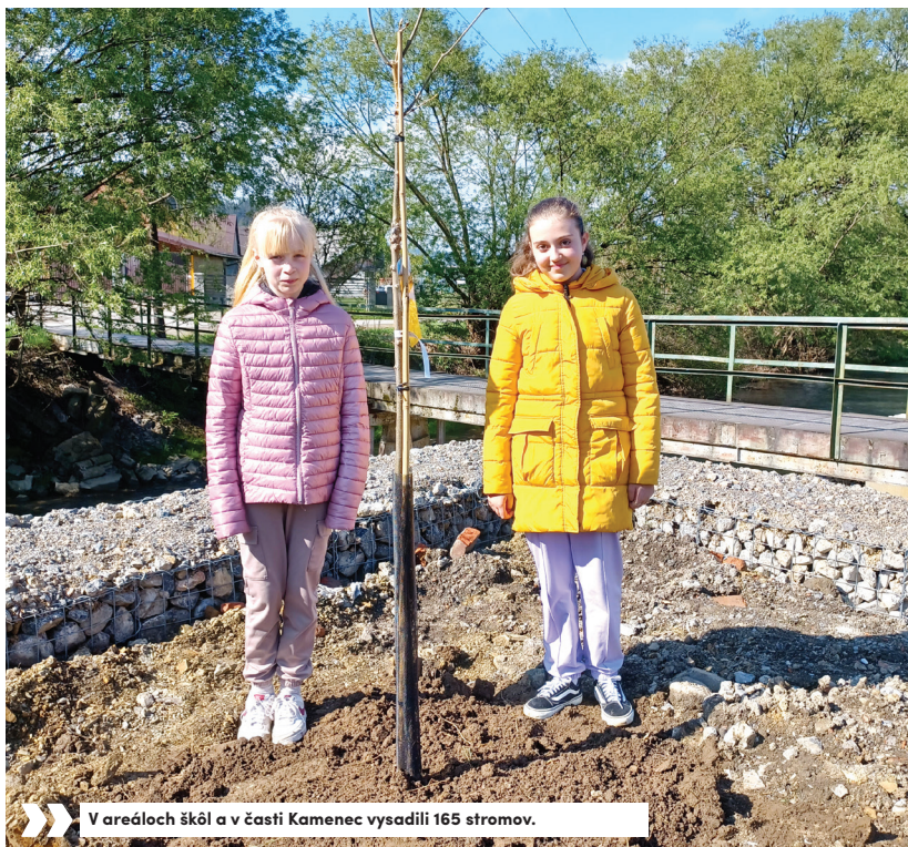
» V areáloch škôl a v časti Kamenec vysadili 165 stromov.

Obec bola úspešná vo výzve Ministerstva investícií, regionálneho rozvoja a informatizácie SR. Zdroje vo výške 120-tisíc eur prinesú okrem iného zlepšenie kvality digitálnych služieb občanom, vrátane ich vývoja, testovania a zavedenia do užívania.