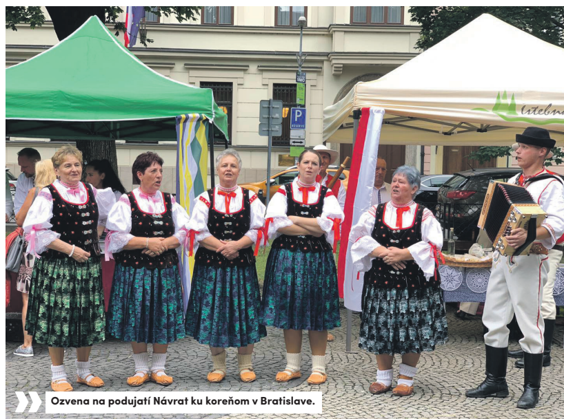
Ozvena na podujatí Návrat ku koreňom v Bratislave.

Autor textu Milan Michnica