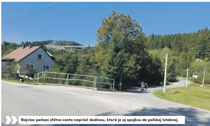
Najviac peňazí zhltnie cesta naprieč dedinou, ktorá je aj spojkou do poľskej Istebnej.