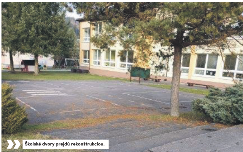
Školské dvory prejdú rekonštrukciou.