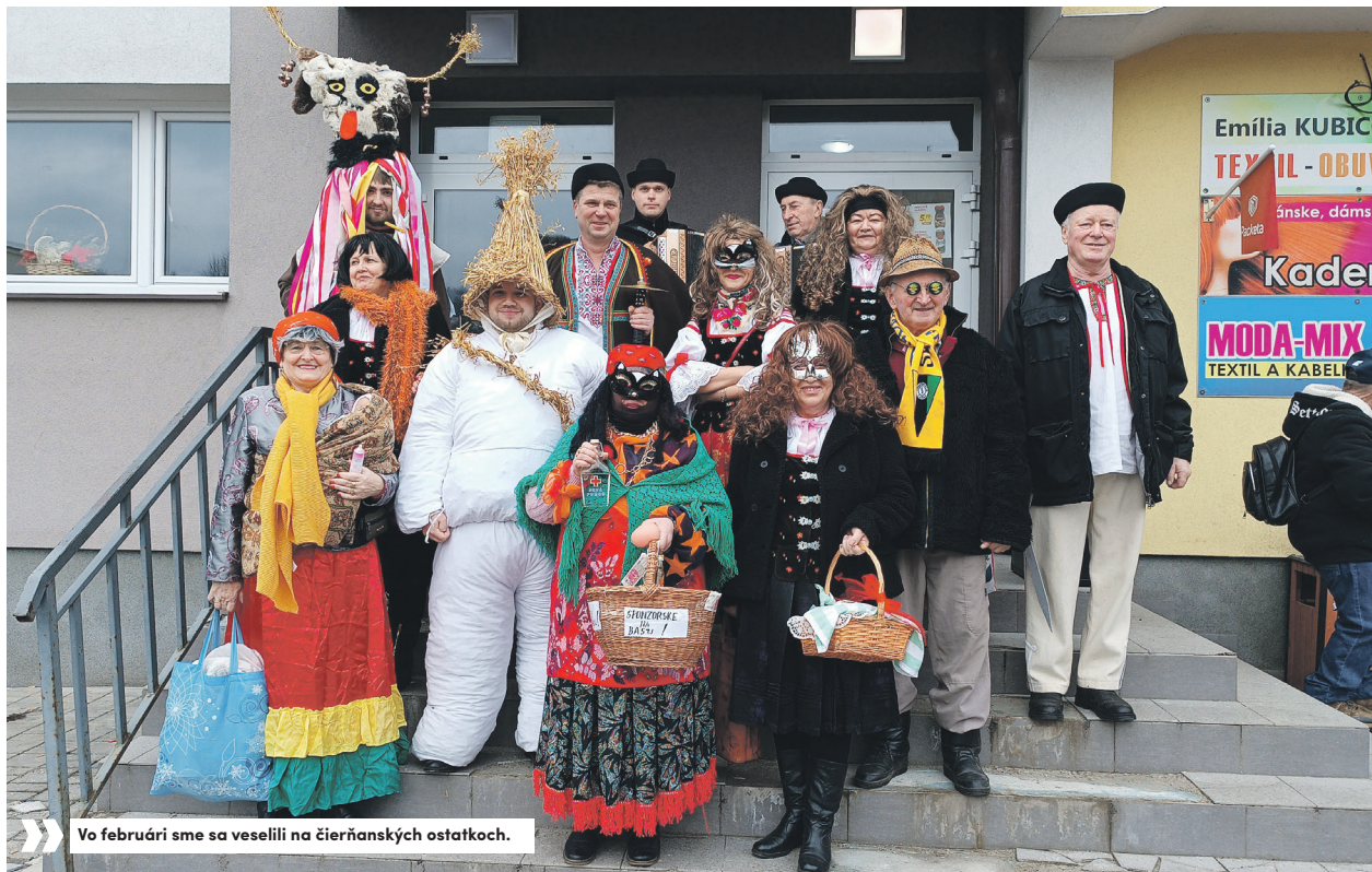
» Vo februári sme sa veselili na čierňanských ostatkoch.