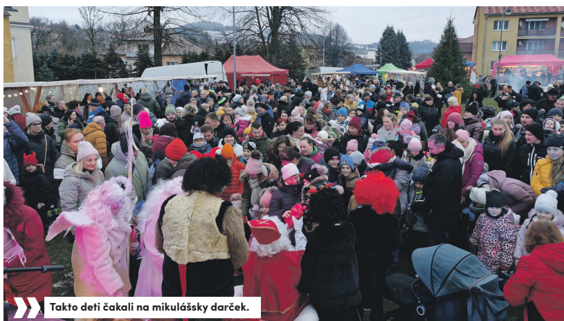
» Takto deti čakali na mikulášsky darček.