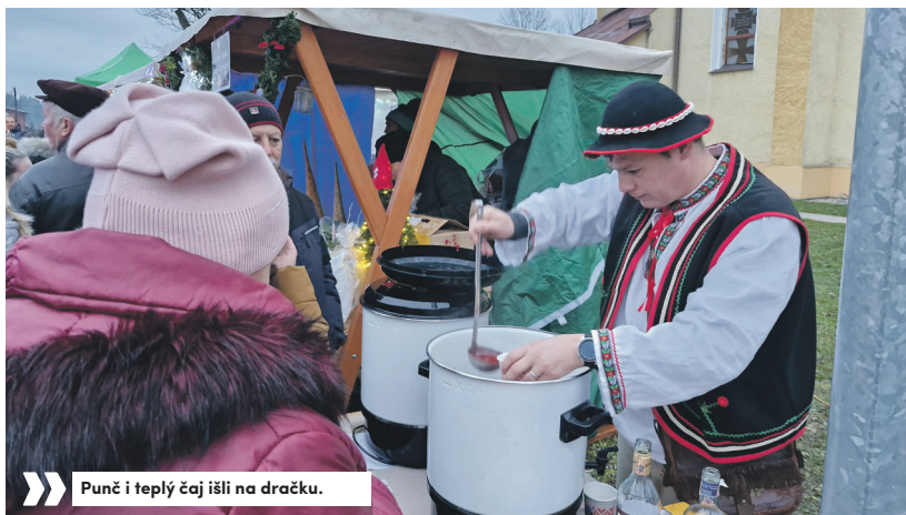
» Punč i teplý čaj išli na dračku.