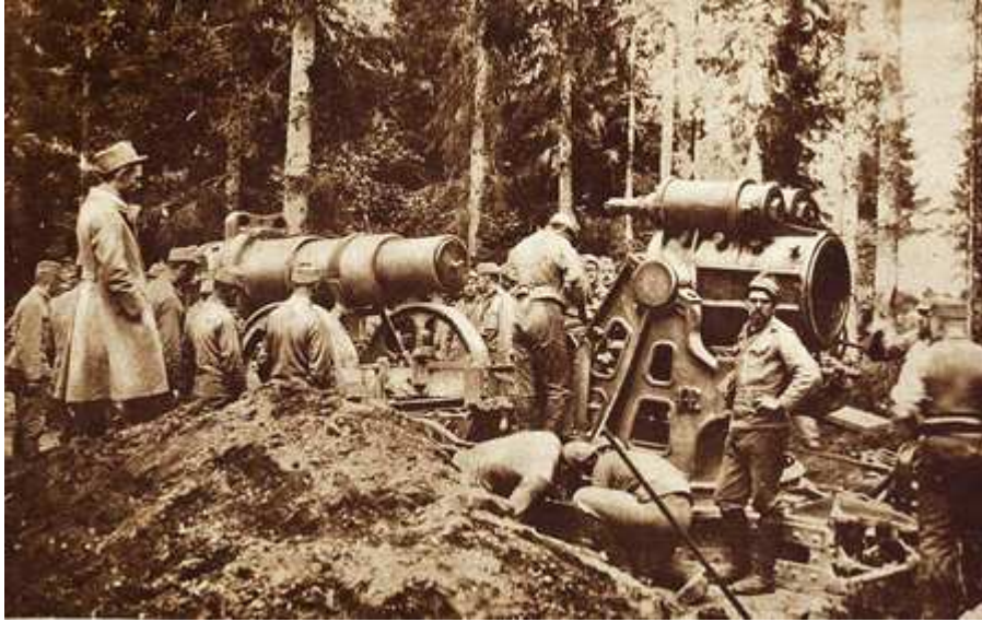
Boje v Karpatoch: Chlapi z Čierneho boli aj u artilérie. Na snímke mažiar vyrobený závozom Škoda.