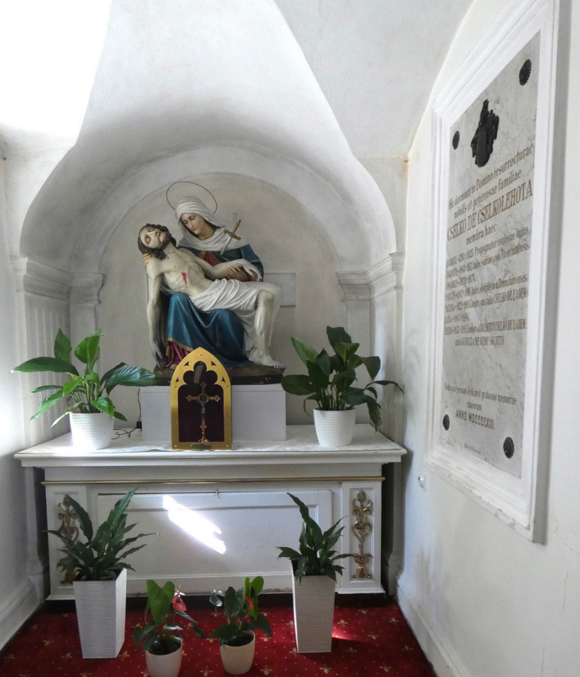
Hrobka Čelkocov v Kysuckom Novom Meste www.kysuckenovemesto.sk