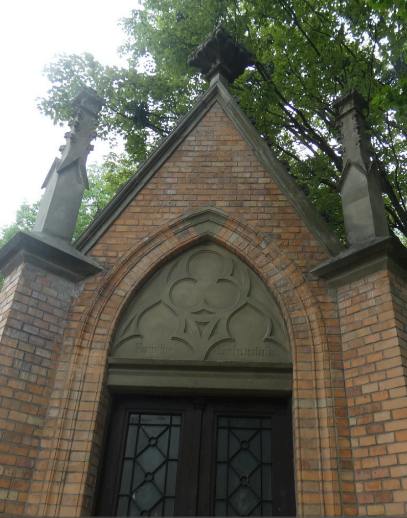
Hrobka Šustalů v Kopřivnici