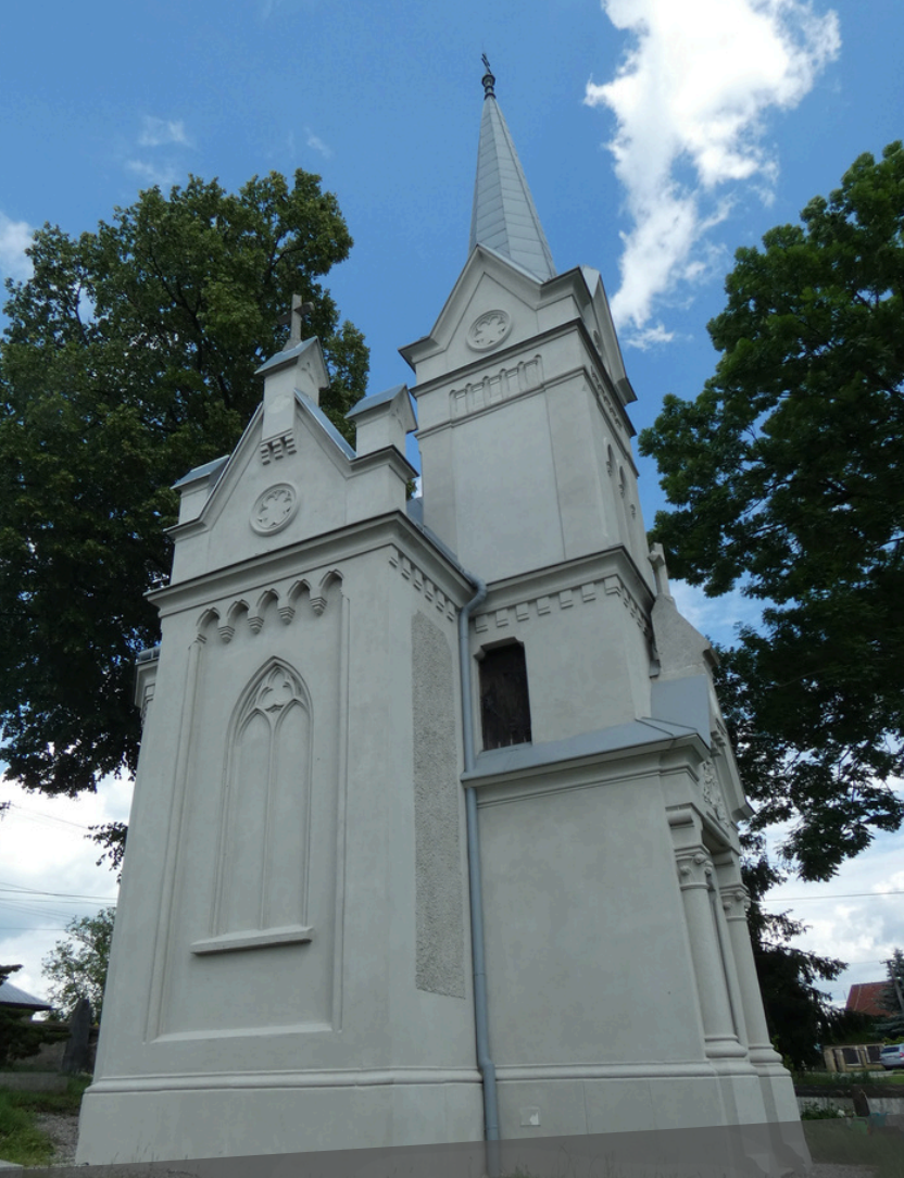
Mauzóleum Rakovských v Rakove