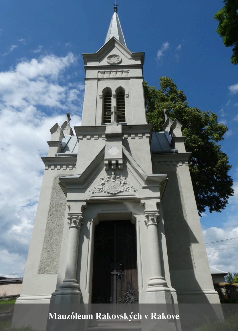
Mauzóleum Rakovských v Rakove