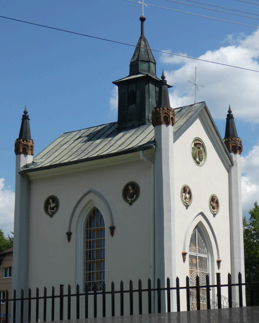
Mauzóleum Náriovcov v Gbelanoch www.gbelany.eu