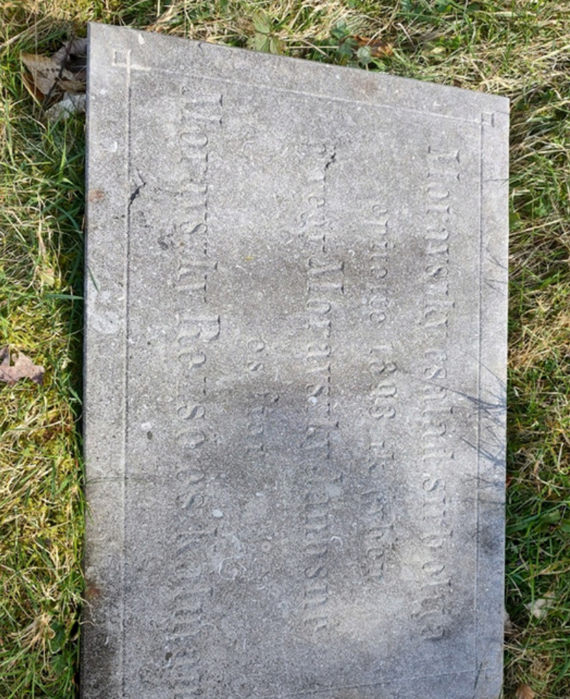
Tabuľa z rozpadnutého tympanónu s letopočtom 1893 a v maďarčine zaznamenanými menami stavitel'ov