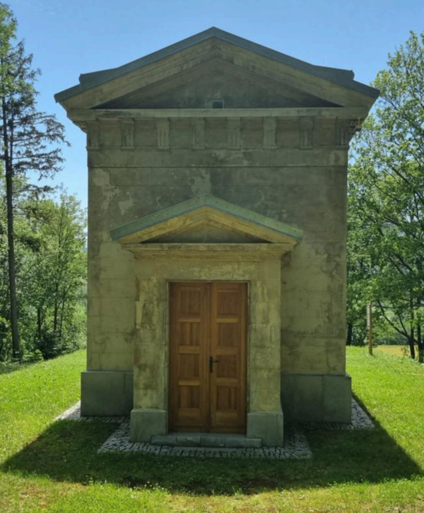
Hrobka Keilů v Albrechticích