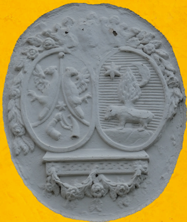
Erby Pongrácovcov zo Svätého Mikuláša a Starhradu (Pongrácz de Szentmiklós et Óvár) a Motešických z Motešíc a Sivého kameňa (Motesiczky de Motesicz et Kesselőkeő) nad vstupom do hrobky