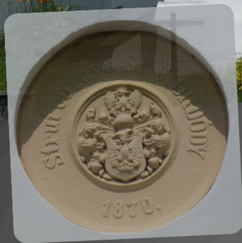
Hrobka Ordódyovcov v Svederníku www.svedernik.info