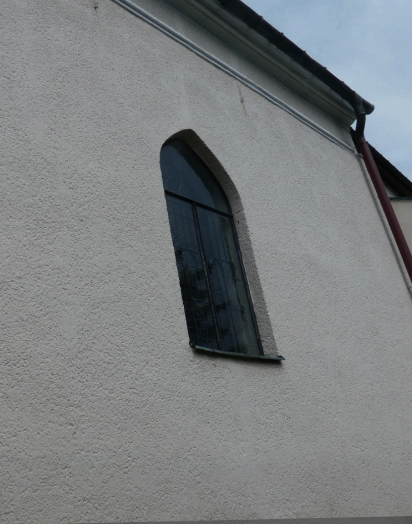
Hrobka Pongrácovcov vo Varíne