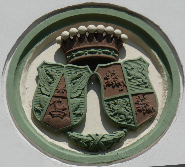
Erby Pongrácovcov zo Svätého Mikuláša a Starhradu (Pongrácz de Szentmiklós et Óvár) a Ňáriovcov z Bedegu a Branča (Nyáry de Bedegh et Berencs) na priečelí mauzólea