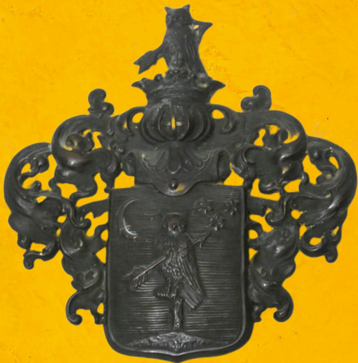
Erb rodu Čelko z Čelkovej Lehoty (Cselkó de Cselkólehota)