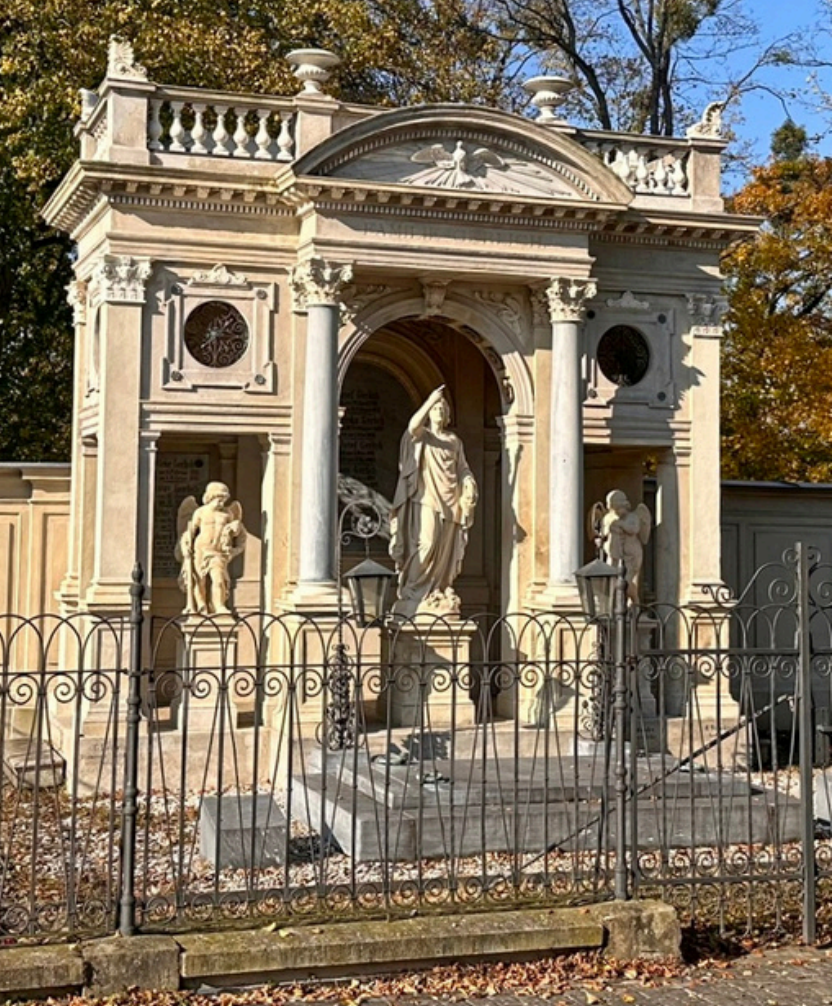
Hrobka Gerlichů v Odrech www.odry.cz