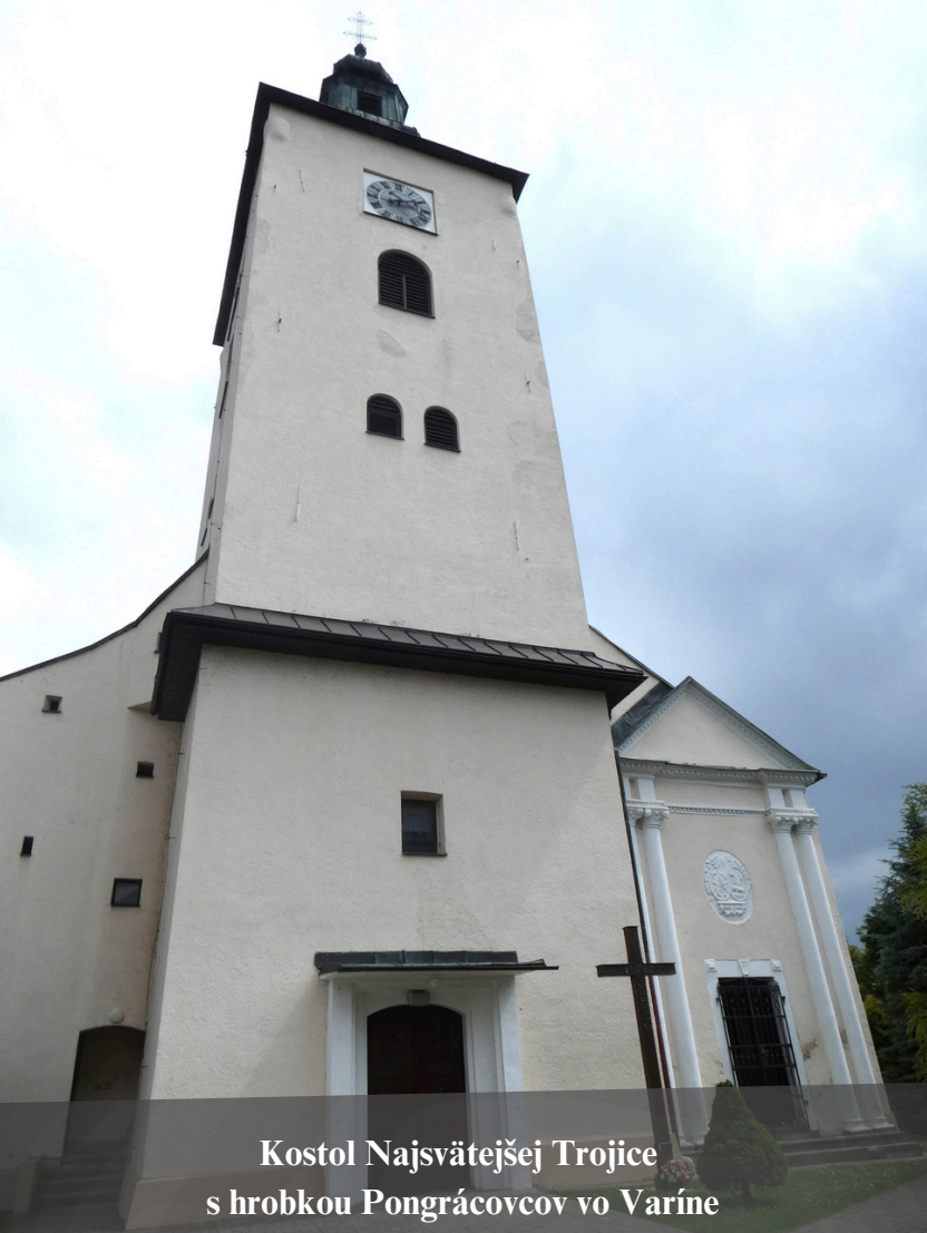
Kostol Najsvätejšej Trojice s hrobkou Pongráčovcov vo Varíne