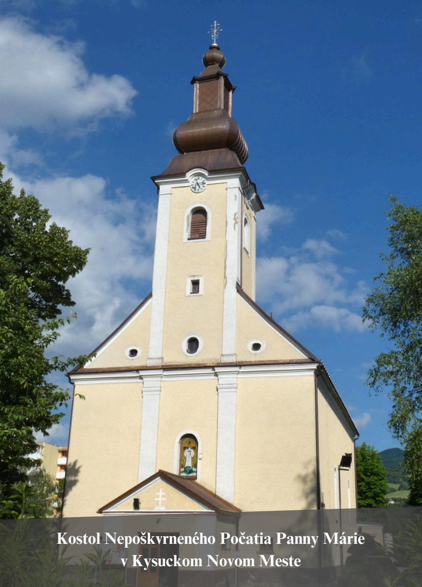
Kostol Nepoškvrneného Počatia Panny Márie v Kysuckom Novom Meste