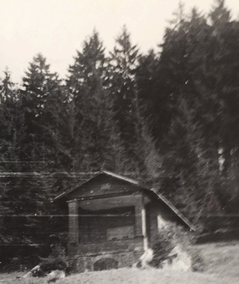
Hrobka Moravských v Čiernom 60. roky 20. storočia