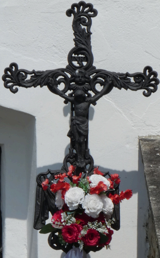
Hrobka Ordódyovcov v Svederníku