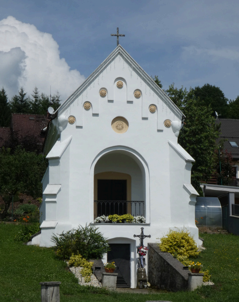
Hrobka Ordódyovcov v Svederníku