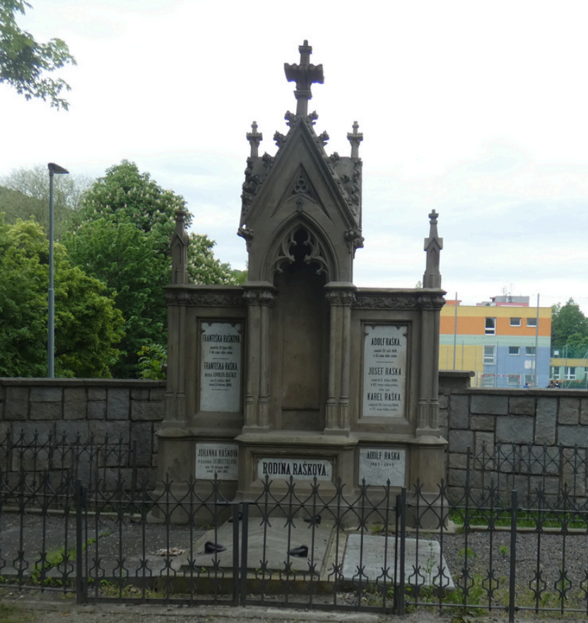
Hrobka Rašků v Koprivnici www.koprivnice.cz