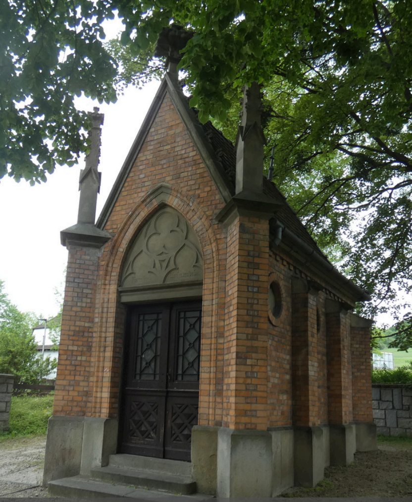
Hrobka Šustalů v Koprivnici www.koprivnice.cz