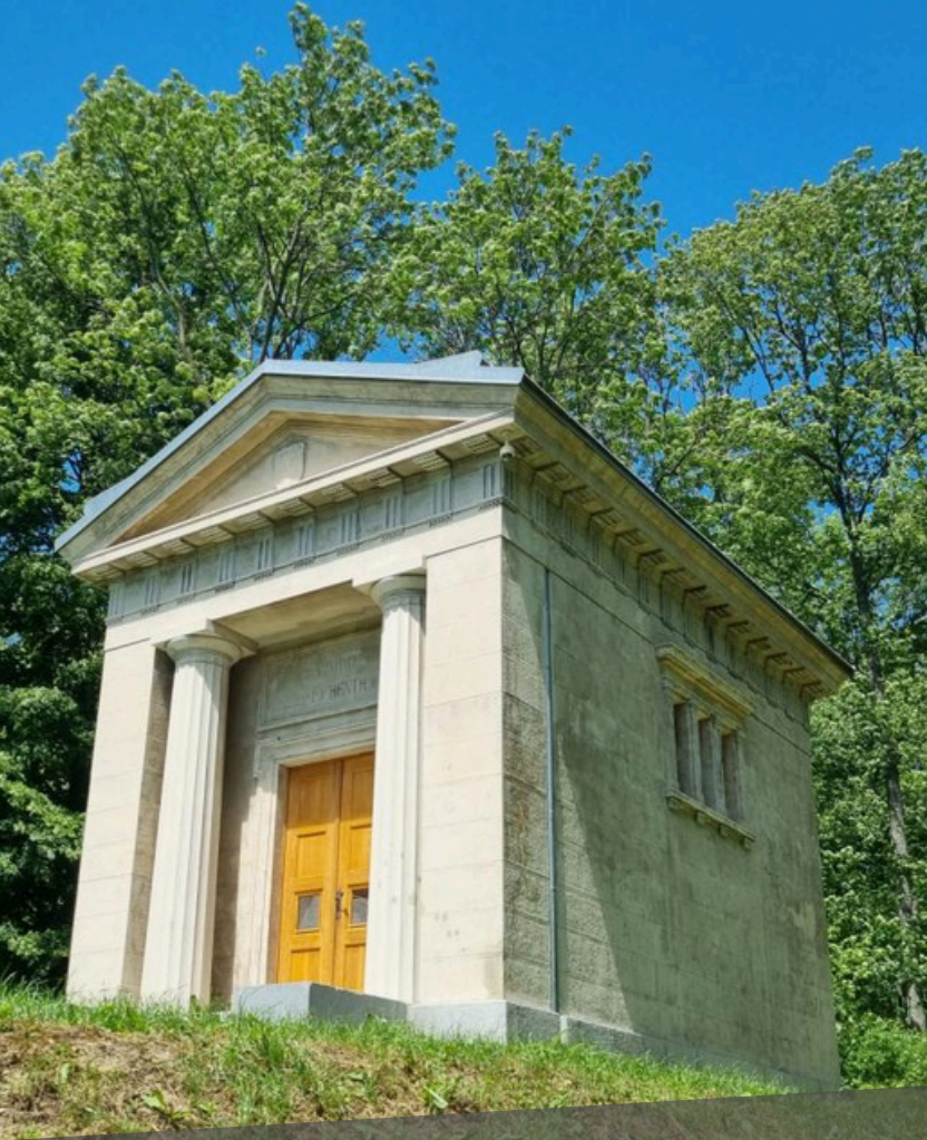
Hrobka Keilů v Albrechticích www.mesto-albrechtice.cz