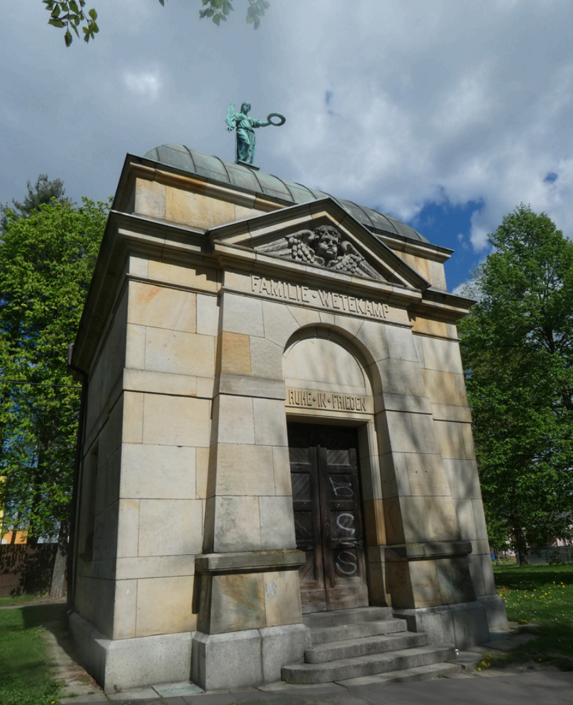
Hrobka Wettekampů v Hlučíně www.hlucin.cz